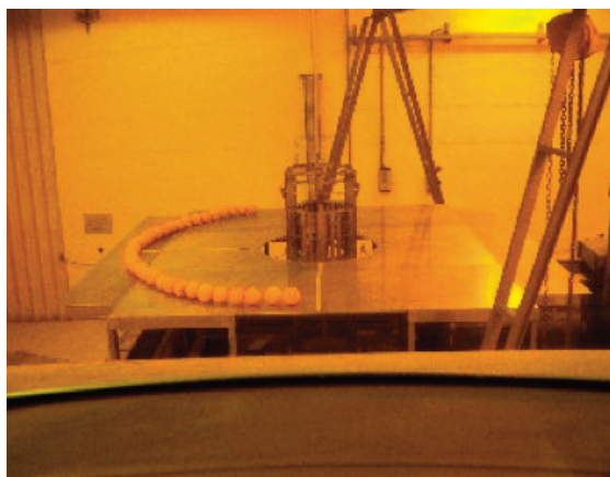
Irraggiamento di agrumi (CRA)